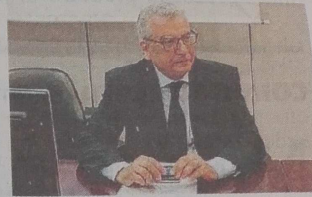
SANTI MARIA CASCONO

A questa proposta si affianca anche il pensiero del presidente dell'Inu Sicilia (Istituto nazionale di Urbanistica) Paolo La Greca: «Iniziativa come quella proposta dagli ingegneri di Catania sono valide per creare le necessarie